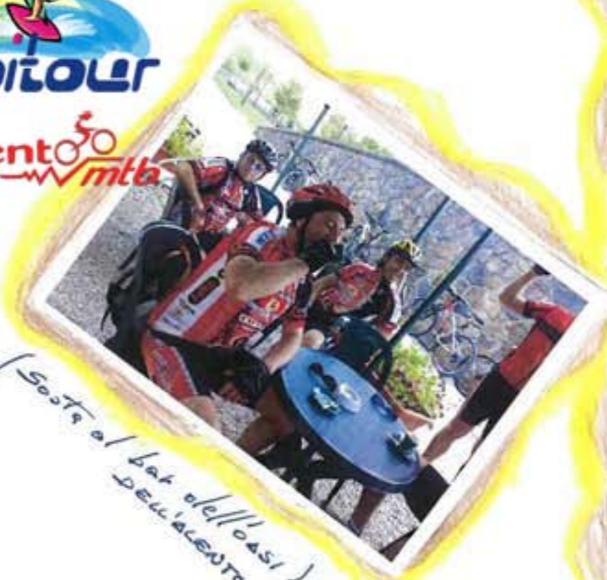
(Sosta al bar dell'orzi)